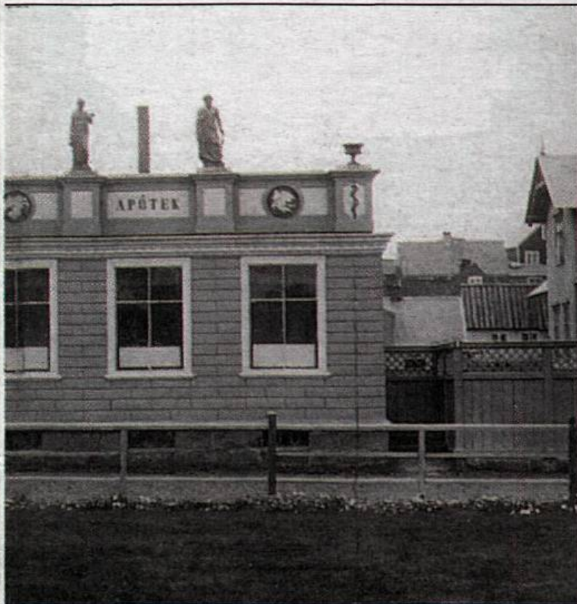
THORVALDSENSSTRÆTI 6 um aldamótin síðustu. Á viðbyggingunni, sem reist var 1881, voru settar upp tvær eirstyttur eftir Bertel Thorvaldsen af Asklepíosi lækningaguði og Hebu, gyðju eilífrar æsku. Stytturnar hafa um áraradír staðið í sal núverandi Reykjavíkur Apóteks.