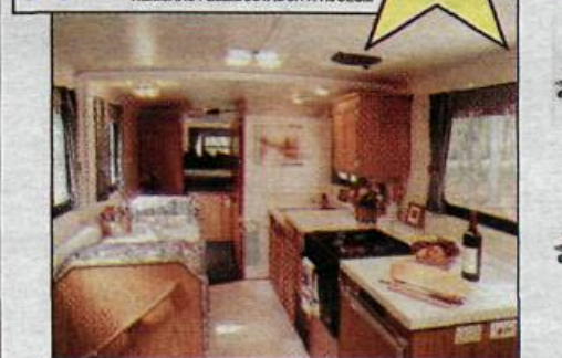
Heilsárs fellibústaður með öllum lúxuspægindum fyrir fjölskylduna í ferðalagið