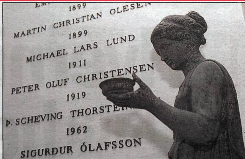
HEBA, gyðja eilífrar æsku, er önnur tveggja stytta Bertels Thorvaldsen, sem fylgt hefur Reykjavíkur Apóteki síðan fyrir aldamót.