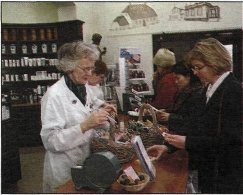
INNRETTINGAR apóteksins hafa verið friðaðar. Ekki hefur verið ákveðið hvers konar starfsemi tekur við þegar apótekið hættir.