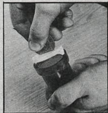
Nýja lyfjaglasíð sem allar íslenzkar pillur verða bráðum í.